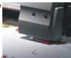
Ein Rotlicht-Marker positioniert den Werkzeugkopf punktgenau.

Ein optisches „Auge“ ermöglicht die fortlaufende Erkennung von Passermarken. Hierüber wird automatisch die Länge, die Breite, eine Schiefelage oder eine trapezförmige Verzerrung korrigiert und ermöglicht so einen präzisen Konturschnitt.