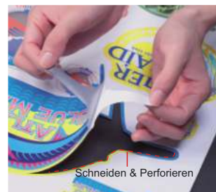
Die HalfCut-Funktion ist Mimakis eigene Technologie.